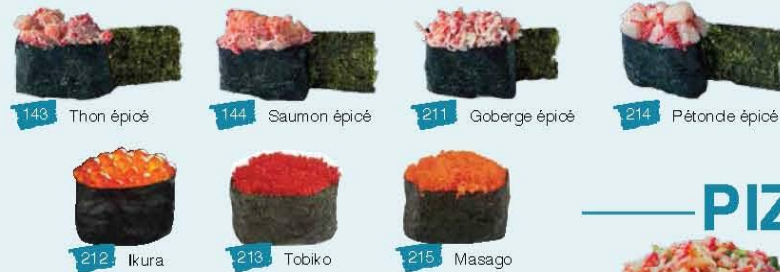
143 Thon épicé 144 Saumon épicé 211 Goberge épicé 214 Pétonde épicé 212 Ikura 213 Tobiko 215 Masago