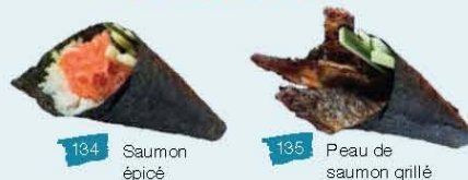
134 Saumon épicé 135 Peau de saumon grillé

Des frais supplémentaires seront chargés pour la nourriture gaspillée 1$ le morceau S.V.P. Veuillez nous informer de vos allergies