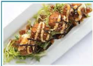
521 - TAKOYAKI TAKOYAKI