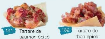
131 Tartare de saumon épicé 132 Tartare de thon épicé