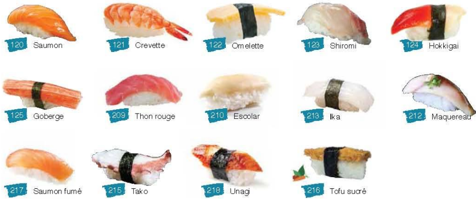
120 Saumon 121 Crevette 122 Omelette 123 Shiromi 124 Hokkigai 125 Goberge 209 Thon rouge 210 Escolar 213 Ika 212 Maquereau 217 Saumon fumé 218 Tako 219 Unagi 216 Tofu sucré