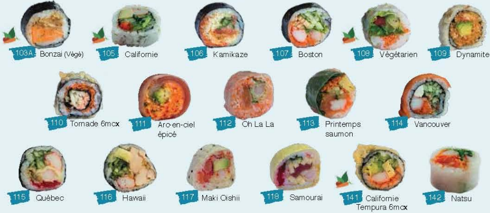
103A Bonzai (Végé) 105 Californie 106 Kamikaze 107 Boston 109 Végétarien 109 Dynamite 110 Tornade 6mrx 111 Arc-en-ciel épicé 112 Oh La La 113 Printemps saumon 114 Vancouver 115 Québec 116 Hawaii 117 Maki Oishii 118 Samurai 141 Californie Tempura 6mrx 142 Natsu