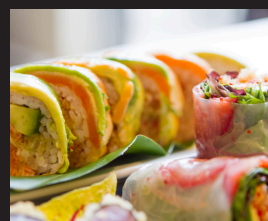
Oh la la