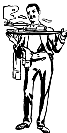
PLANCHE INDIVIDUELLE 43

Choisissez trois entrées pour composer un plat principal.